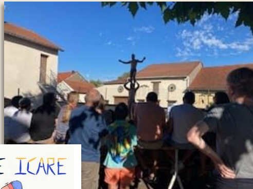
Spectacle de Cirque - Belle Icare